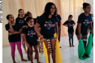
PROGRAMA AMIGO DE VALOR