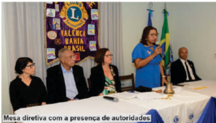
Mesa diretiva com a presença de autoridades