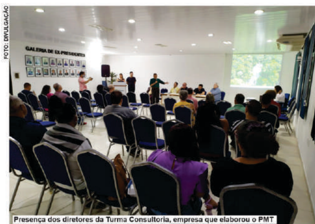
Presença dos diretores da Turma Consultoria, empresa que elaborou o PMT