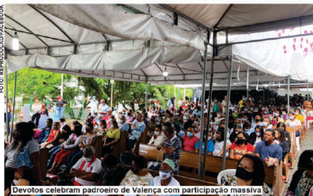
Devotos celebram padroeiro de Valença com participação massiva