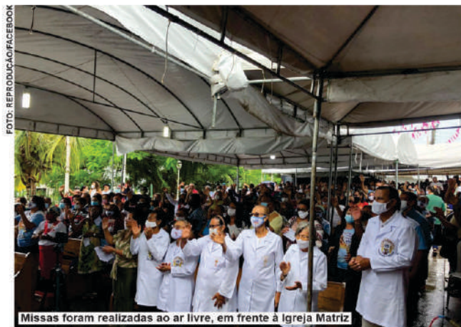
Missa foram realizadas ao ar livre, em frente à Igreja Matriz