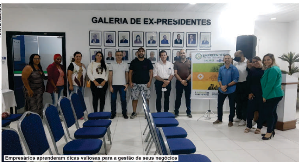
Empresários aprenderam dicas valiosas para a gestão de seus negócios