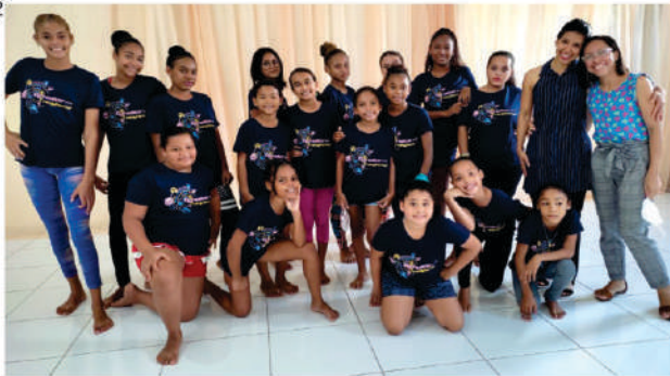
PROGRAMA AMIGO DE VALOR

A oficina de Dança está a todo vapor, as aulas são desenvolvidas para estimular o aprendizado associadas com as atividades socio-educativas. A expressão corporal se mostra como uma forma do indivíduo dizer o que sente por meio de movimentos. Tem sido um tempo renovador de esperança e alegria.