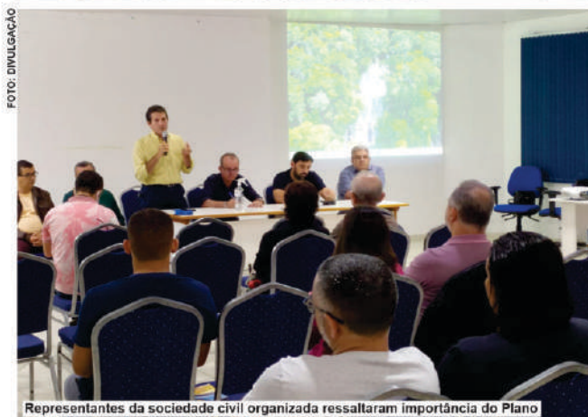
Representantes da sociedade civil organizada ressaltaram importância do Plano

dido em dez seções contendo dados históricos, socioeconômicos e ambientais, panorama turístico, competitividade, presença digital, empreendedorismo, participação em instâncias, estrutura atual e os eixos estratégicos que trazem o plano de ação para o desenvolvimento do turismo valenciano.