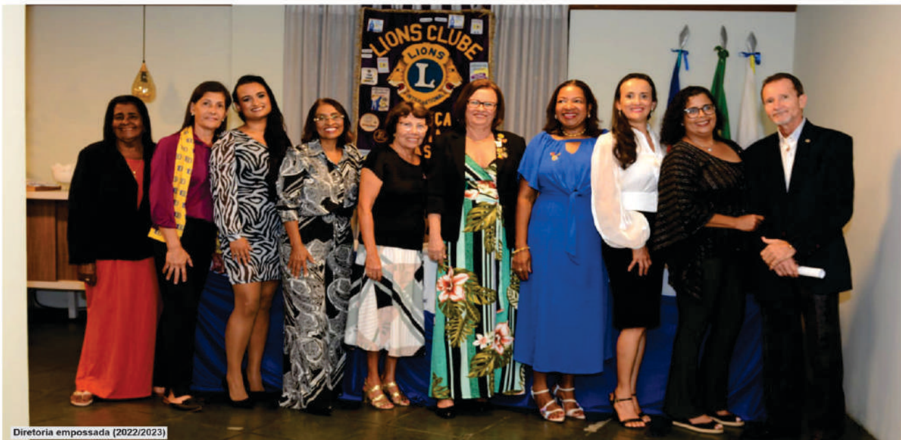
Diretoria empossada (2022/2023)

Clube de serviços renovou presidência e diretoria para a gestão 2022/2023