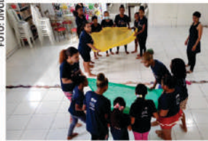
PROGRAMA AMIGO DE VALOR