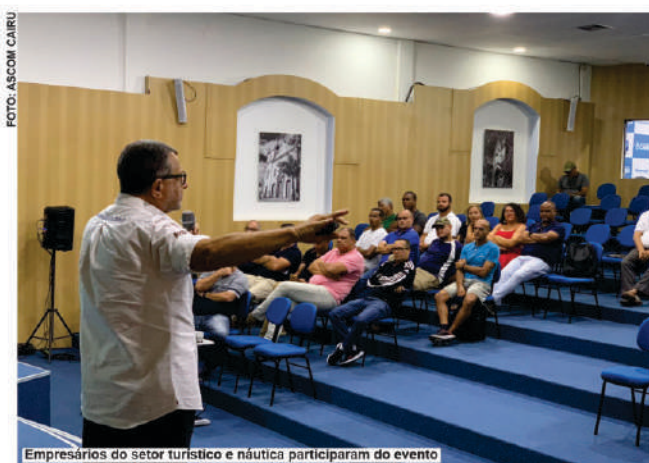
Empresários do setor turístico e náutica participaram do evento

sibilidades de investimentos no município-arquipélago.