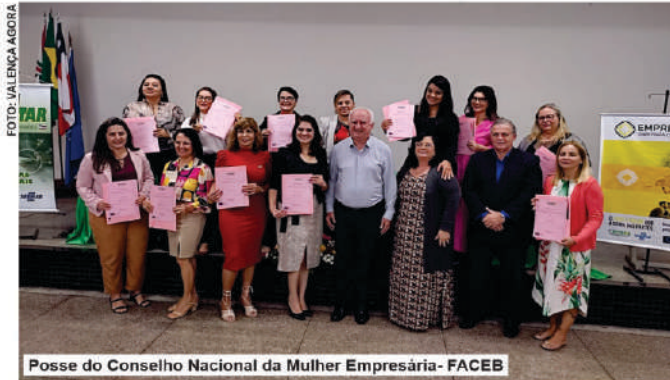
Posse do Conselho Nacional da Mulher Empresária-FACEB

no Programa Capacitar em 2022 e aditivo do Projeto Empreender.