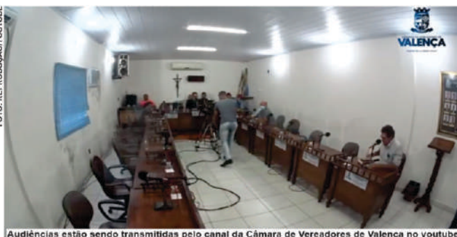
Audiências estão sendo transmitidas pelo canal da Câmara de Vereadores de Valença no youtube