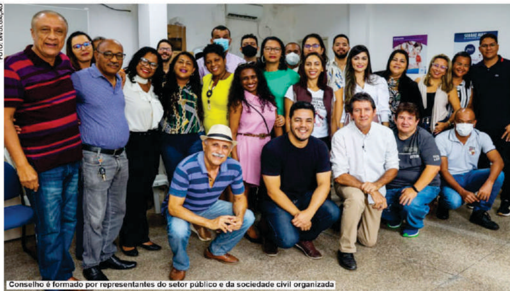
Conselho é formado por representantes do setor público e da sociedade civil organizada

tem a finalidade de contribuir para a construção da política de desenvolvimento urbano, melhorando o sistema municipal de gestão das cidades com foco no urbanismo e na melhoria da qualidade de vida das pessoas. As iniciativas serão baseadas nas resoluções das conferências municipais, estaduais e nacional, incluindo os conselhos das três esferas.