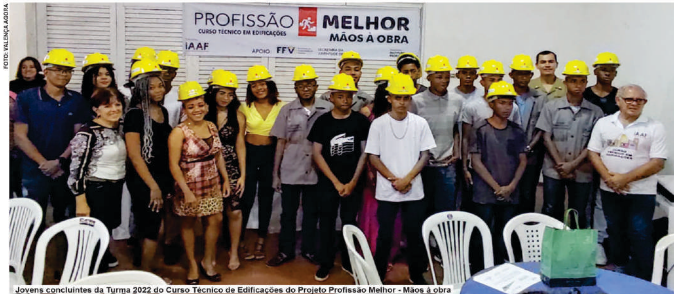
Jovens concluintes da Turma 2022 do Curso Técnico de Edificações do Projeto Profissão Melhor - Mãos à obra

Iniciativa de cunho social visa capacitar jovens para ingressarem no mercado de trabalho e transformarem suas realidades