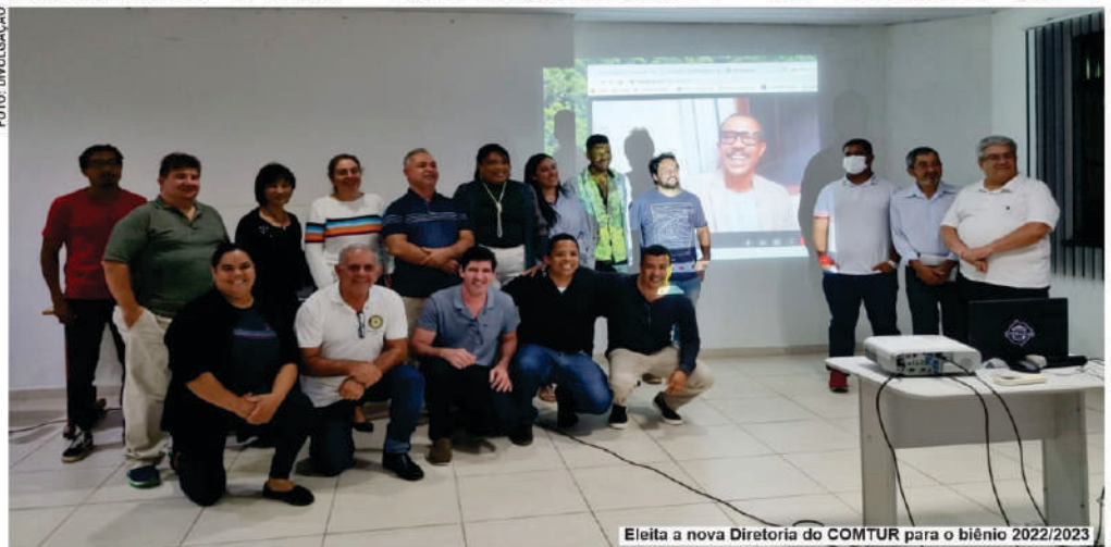
Eleita a nova Diretoria do COMTUR para o biênio 2022/2023