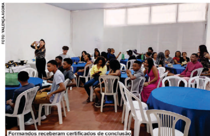
Formandos receberam certificados de conclusão