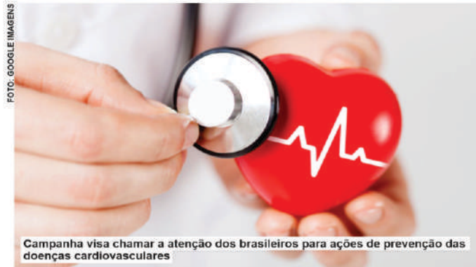
Campanha visa chamar a atenção dos brasileiros para ações de prevenção das doenças cardiovasculares

De acordo com a instituição, essas taxas podem ser ainda maiores, já que as pessoas ficaram mais sedentárias, ganharam peso e procuraram menos o médico ao longo da pandemia de covid-19. Levantamento feito pela Socesp mostrou que entre uma população que já se caracteriza por não praticar exercícios rotineiramente, entre aqueles que afirmam ser sedentários (65,8%) pelo me-