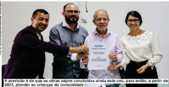
A previsão é de que as obras sejam concluídas ainda este ano, para então, a partir de 2023, atender as crianças da comunidade