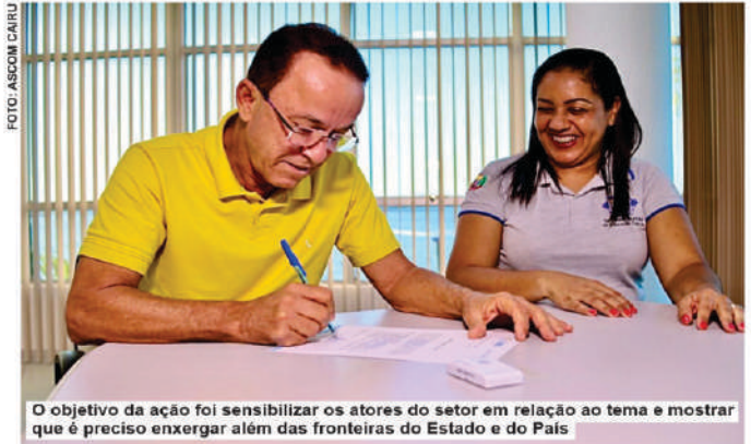
O objetivo da ação foi sensibilizar os atores do setor em relação ao tema e mostrar que é preciso enxergar além das fronteiras do Estado e do País

Localizada na Avenida Santo Antônio, bairro da Cajazeira, na Pista, a nova creche de Cairu está projetada para atender 240 crianças menores de cinco anos, com seis salas de aula, cozinha, refeitório, pátio coberto, secretaria, sanitários - inclusive para pessoas com necessidades especiais -, entre outros ambientes apropriados para o desenvolvimento escolar da guri-