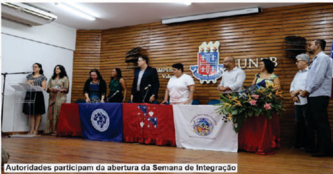
Autoridades participam da abertura da Semana de Integração