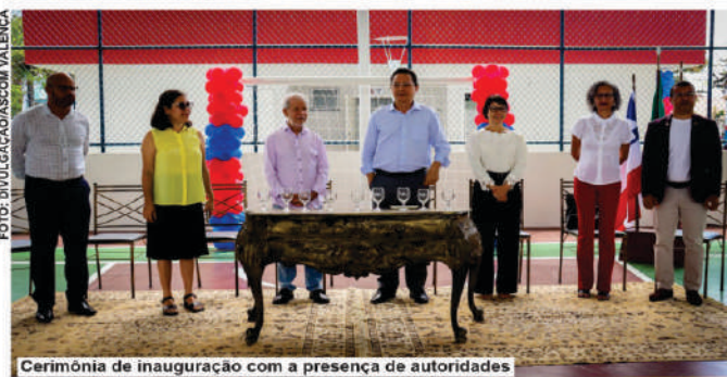
Cerimônia de inauguração com a presença de autoridades

O complexo esportivo conta com duas quadras, uma com cobertura, um campo society e vestiários, uma estrutura adequada e montada especialmente para os alunos que irão desfrutar desse