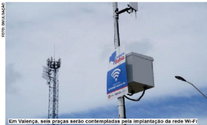
Em Valença, seis praças serão contempladas pela implantação da rede Wi-Fi

A Prefeitura de Valença assinou, nesta terça-feira (27), o convênio de cooperação técnica de um dos maiores programas de inclusão digital em curso no Brasil: o Conecta Bahia. Executado pela Secretaria de Ciência, Tecnologia e Inovação (SECTI), o programa do Governo do Estado leva internet Wi-Fi grátis para praças e prédios públicos de diversas cidades baianas.