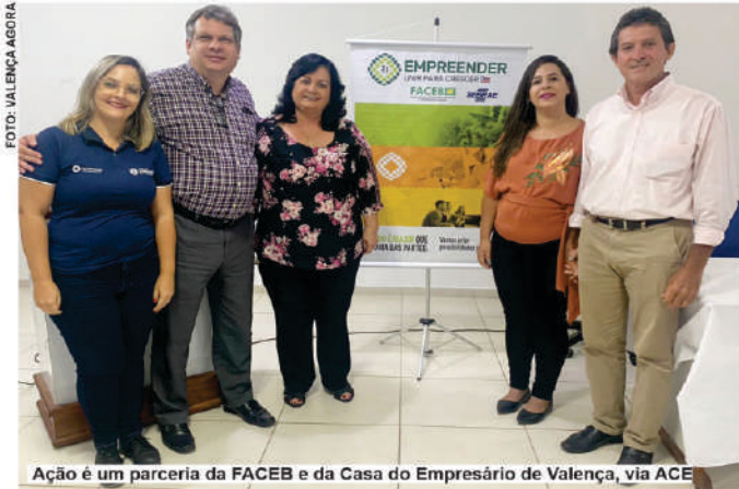
Ação é uma parceria da FACEB e da Casa do Empresário de Valença, via ACE