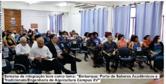
Semana de integração leva como tema: "Embarque: Porto de Saberes Acadêmicos e Tradicionais/Engenharia de Aquicultura Campus XV"

O Departamento de Educação - Campus XV, da Universidade do Estado da Bahia- UNEB, situado em Valença, realizou nesta terça-feira (27) a abertura oficial do primeiro curso de Engenharia de Aquicultura do Estado da Bahia, em parceria com a