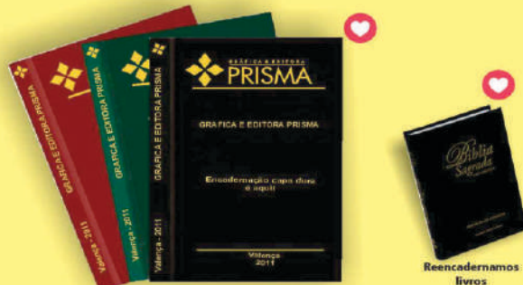
Monografias e livros fiscais c/ pintura na capa