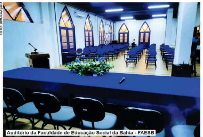
Audatório da Faculdade de Educação Social da Bahia - FAESB