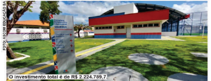
O investimento total é de R$ 2.224.789,7.

O colégio, recentemente, também passou por reforma civil e elétrica, com a realização de serviços de revestimento cerâmico, piso cimentado e piso de concreto, além de revisão de instalações