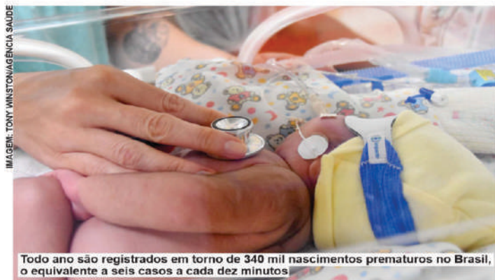
Todo ano são registrados em torno de 340 mil nascimentos prematuros no Brasil, o equivalente a seis casos a cada dez minutos

“Aqueles pais de prematuros que responderam a pesquisa e que passaram pela experiência, disseram que antes de ter um prematuro tinham pouquíssimas informações a respeito disso. Então, quer dizer que a gente precisa falar mais durante o pré-natal, informar as mulheres em idade fértil, trazer o tema à tona para toda sociedade para que, caso venha a acontecer um parto prematuro, os riscos sejam menores, tanto para mãe quanto para o bebê”, destacou