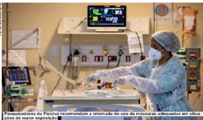
Pesquisadores da Fiocruz recomendam a retomada do uso de máscaras adequadas em situações de maior exposição

A SRAG é uma complicação respiratória que demanda hospitalização e está associada muitas vezes ao agravamento de alguma infecção viral. O paciente pode apresentar desconforto respiratório e queda no nível de saturação de oxigênio, entre outros sintomas.