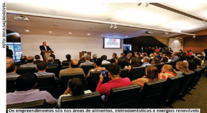
Os empreendimentos são nas áreas de alimentos, eletrodomésticos e energias renováveis

Os empreendimentos são nas áreas de alimentos, eletrodomésticos e energias renováveis. Os municípios beneficiados são Conceição do Jacuípe, Simões Filho, Gentio do Ouro, Sobradinho e Juazeiro. As signatárias dos protocolos com o Governo da Bahia são as empresas M. K BR