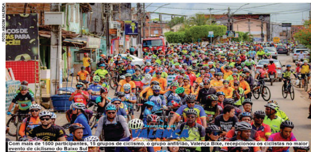
Com mais de 1500 participantes, 15 grupos de ciclismo, o grupo anfitrião, Valença Bike, recepcionou os ciclistas no maior evento de ciclismo do Baixo Sul

O ciclismo é um esporte que tem crescido e ganhado adeptos ao longo dos anos, os benefícios são inúmeros para os que praticam esse esporte. Pedalar é um exercício aeróbico, mas tam-