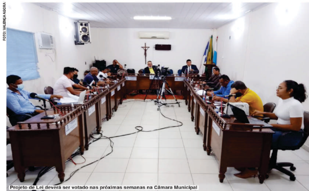
Projeto de Lei deverá ser votado nas próximas semanas na Câmara Municipal