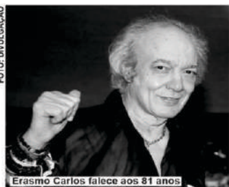
Erasmo Carlos falece aos 81 anos