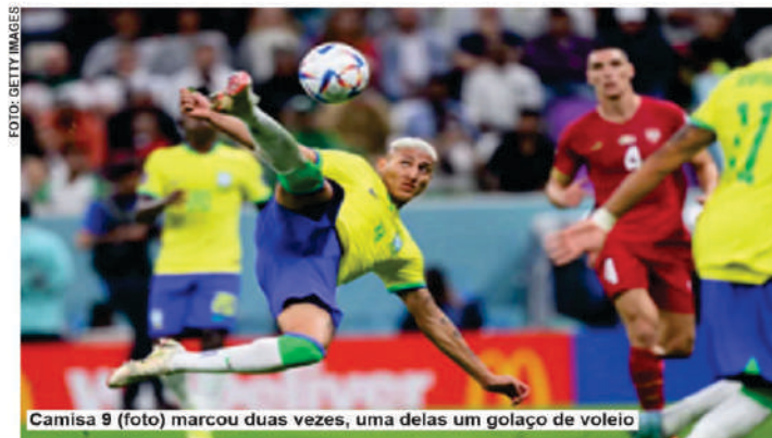
Camisa 9 (foto) marcou duas vezes, uma delas um golaço de voleio

da rodada do Grupo G, o Brasil pega a Suíça a partir das 13h (horário de Brasília). Já Sérvia e Camarões, derrotados na primeira rodada, buscarão a reabilitação no mesmo dia, mas a partir das 7 horas.