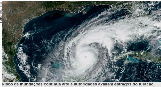
Risco de inundações continua alto e autoridades avaliam estragos do furacão

O olho do furacão Milton, que viajou durante a noite de quarta-feira (9) de perto da área da Baía de