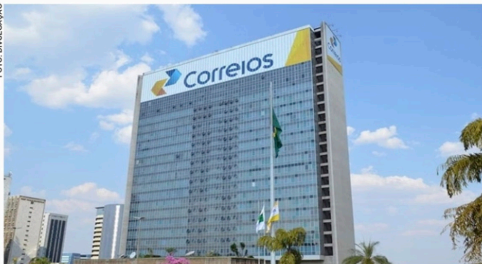
A taxa de inscrição para o cargo de nível médio é de R$ 39,80 e, para o nível superior, de R$ 42,00