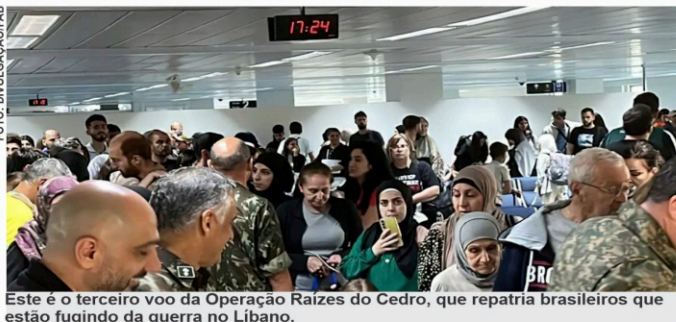
Este é o terceiro voo da Operação Raízes do Cedro, que repatria brasileiros que estão fugindo da guerra no Líbano.

no. A aeronave fará uma parada em Lisboa para reabastecimento antes