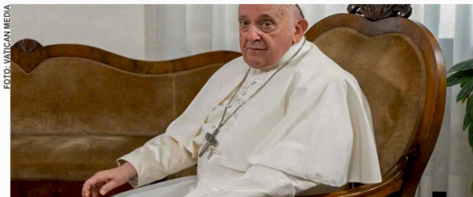
Da janela do Palácio Apostólico, Francisco lamentou o fato de o Oriente Médio ter “caído num sofrimento cada vez maior”

Da janela do Palácio Apostólico, Francisco lamentou o fato de o Oriente Médio ter “caído num sofrimento cada