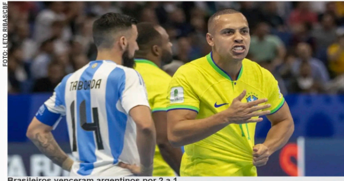
Brasileiros venceram argentinos por 2 a 1