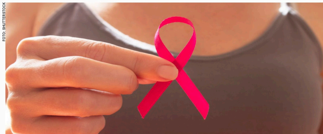
É necessário um bom acompanhamento médico para avaliar constantemente os riscos de desenvolver o problema, principalmente a partir dos 50 anos.

No entanto, para que isso ocorra, é preciso ter atenção ao próprio corpo e saber identificar possíveis alterações relacionadas ao problema . Confira os principais sintomas do câncer de mama e os fatores de risco que elevam o seu desenvolvimento.