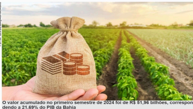
O valor acumulado no primeiro semestre de 2024 foi de R$ 51,96 bilhões, correspondendo a 21,69% do PIB da Bahia

No segundo trimestre de 2024, o maior destaque foi para o agregado II, que engloba a agropecuária proprie-