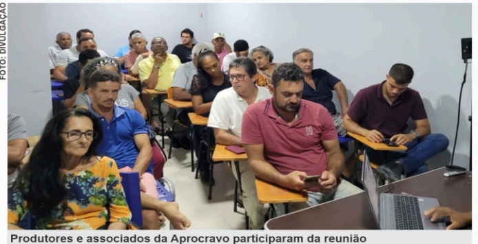
Produtores e associados da Aprocravo participaram da reunião

começa a entender a responsabilidade de toda a população, de quem planta, de quem comercializa, de todos que integram a cadeia produtiva do cravo-da-índia”, destacou. “Isso não quer dizer que vai ser eliminado o atravessador. Tem espaço para todos. Isso vai fazer com que o produtor produza um produto de melhor qualidade, o atravessador também pague um preço melhor, porque vai estar recebendo um produto de melhor qualidade, e toda a economia sai ganhando. Sai ganhando o posto de gasolina, sai ga-