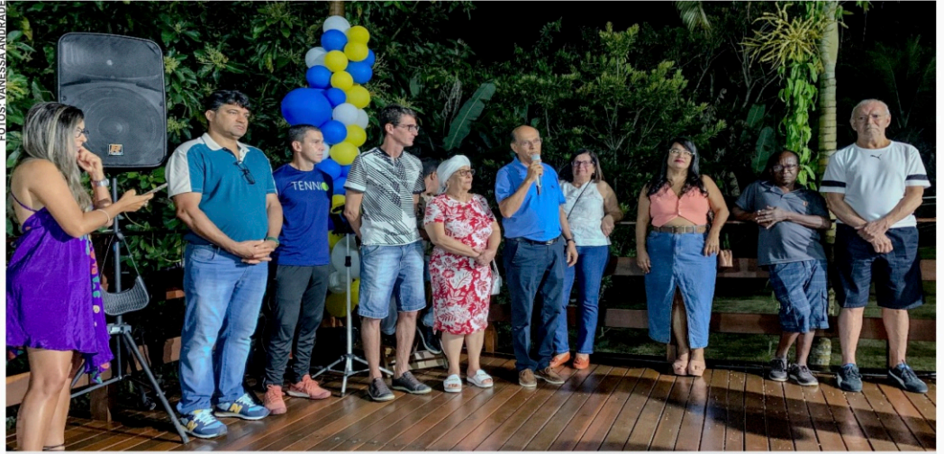
Cerimônia de inauguração da AABB Esporte Center reuniu equipe, associados, autoridades e parceiros

Na cerimônia de abertura do Sport Center, estiveram presentes o presidente do clube,