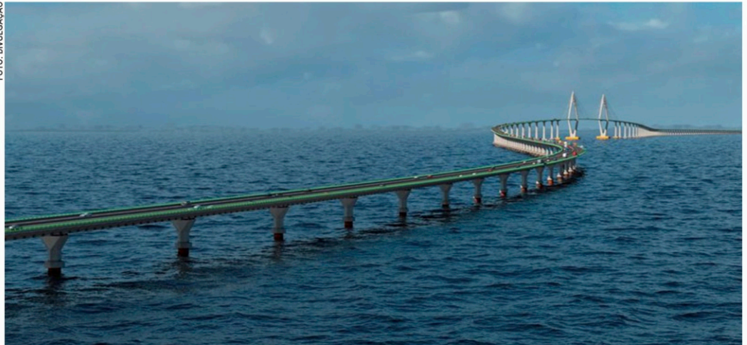
O Sistema será um novo vetor de distribuição de renda e vai impulsionar a economia de toda a Bahia, com geração de sete mil empregos

biente e Recursos Hídricos (INEMA) autorizou a perfuração de parte da Baía de Todos-os-Santos, dando um novo passo para a construção da Ponte Salvador-Itaparica.