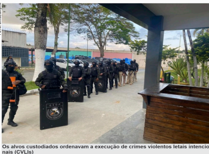
Os alvos custodiados ordenavam a execução de crimes violentos letais intencionais (CVLIs)

lizado em Operações Prisionais (Geop), da Central de Monitoramento Eletrônico de Pessoas